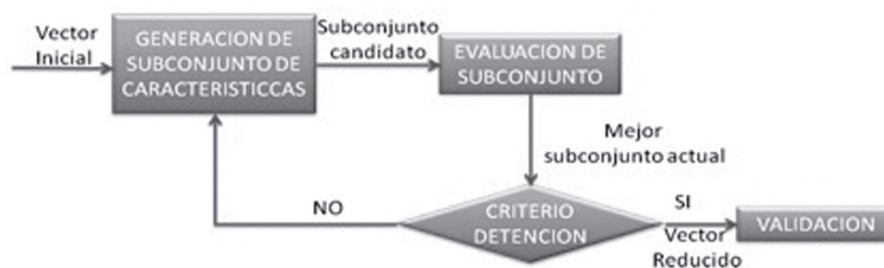
Fig. 1. Proceso de Selección de Características

Los dos aspectos fundamentales en el proceso de selección de características son los criterios de selección y búsqueda. Por lo tanto, los algoritmos de selección de subconjuntos seleccionados fueron basados en filtros, en los cuales la selección de características no tiene en cuenta el clasificador. El procedimiento de selección de características evalúa los atributos de acuerdo con heurísticas basadas en características generales de los datos de forma independiente de la función de evaluación (método de clasificación) que se utilizará posteriormente (Fig. 2).